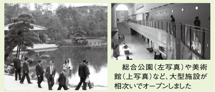
総合公園(左写真)や美術館(上写真)など、大型施設が相次いでオープンしました