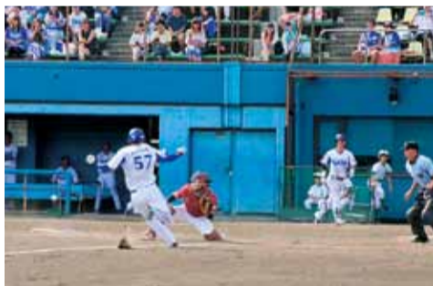
プロ野球の2軍の試合を観戦しませんか

午前10時30分～11時30分。40人。4110円。 ③火曜ストレッチャ 6月25日～10月1日の火曜日、全10回、午後1時30分～2時45分。120人。4110円。 ④産後シェイプアップ体操 6月19日～7月3日の水曜日、全3回、午後1時30分～2時30分。1年以内に出産した方と首の据わった乳児25組。800円。 ⑤楽しくリズムウォーキング 6月20日～10月10日の木曜日、全7回、午前9時15分～10時45分。50人。3080円。 募集 教室名・必要事項・年齢(①はコース名も)を、はがき(1人1枚)で、5月15日(水)までに、〒254-0045見附町31-10まちづくり財団スポーツ事業課☎35-0102へ。同財団ウェブからも申し込みます。