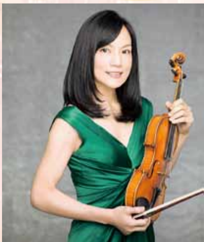
千住真理子: Kiyotaka Sai to (SCOPE)