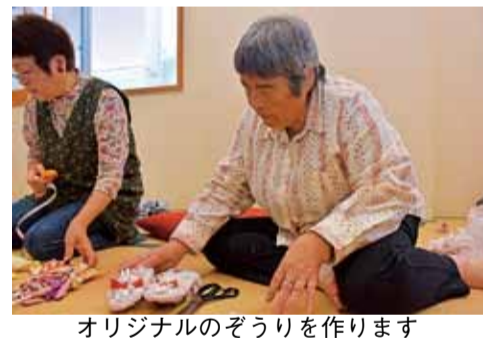
オリジナルのぞうりを作ります

色のきれいな布を使うと、見栄えが良くなります。 5月31日(金)午前9時～正午。リサイクルプラザ(四之宮7-3-5)。16人(抽選)。布・はさみ・ものさし・ピン