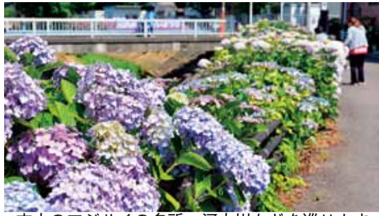
市内のアジサイの名所、河内川などを巡ります

6月11日(火)午前9時～午後0時30分。約6・2km。当日午前7時のNHKの天気予報で横浜の降水確率が50%以上の場合は12日(水)に延期。12日も50%以上の場合は中止。旭南公民館(山下1096-1)集合・解散。帽子・タオル・飲み物・雨具・お持