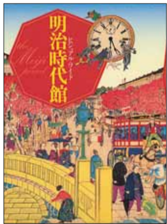
小学館 平成17年発行 中央・北図書館所蔵

そこでお勧めなのが、本書です。近代の始まりとも言える明治時代を、2000点を超える豊富な写真や絵と一緒に分かりやすく紹介しています。 例えば、私たちの生活に必要な不可欠な電話や郵便、街灯は、明治時代に登場しました。これからの季節に おいしいアイスクリームやラムネも同様です。今や当たり前のように食べられている牛肉に至っては、明治時代初期にはゲテモノ扱いされていたのを知っていますか。私たちの生活と似ているようで、けれどやっばりどこかが違う明治時代。本書は写真や絵を眺めているだけで、時間を忘れてしまいそうになります。 明治時代を生きた人々は、目まぐるしく変わっていく生活に、どんな気持ちを抱いていたのでしょうか。昔を懐かしく思い、変化に不安と希望を抱いていたのでしょうか。もしかしたらその心情は、今の私たちと少し、似ているのかもしれないかもしれません。そんなことを想像しながら、ページをめくってみませんか。新しい時代を迎える今だからこそ、何かに気付けるかもしれません。