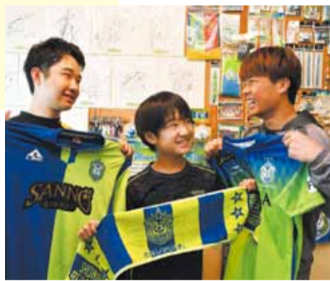
荒木兄弟の自宅にあるベルマーレグッズで埋め尽くされた一室で笑顔の3人

心待ちにしています。「学校で嫌なことがあっても、試合を応援するとリフレッシュできるんです。何があってもベルマーレを信じ続けたいです」と笑顔を見せます。