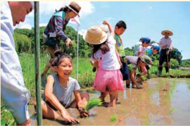
昔ながらの田植えを体験しませんか

6月1日(土)午前10時～午後1時。荒天の場合は2日(日)に延期。里山体験フィールド(土屋1076付近)。市内在住・在勤・在学の方と家族60人(抽選)。帽子・軍手・タオル・飲み物・着替え・おしぼり・雨具など。作業のできる服装・靴でお越しください。 募集 全員の 必要事項 ・生年月日を、はがき・電話・ファクス・メールで、5月22日(水)までに、 環境保全課 ☎23-9969☎21-9603☎k-hozen-event@へ。市ウェブからも申し込みます。