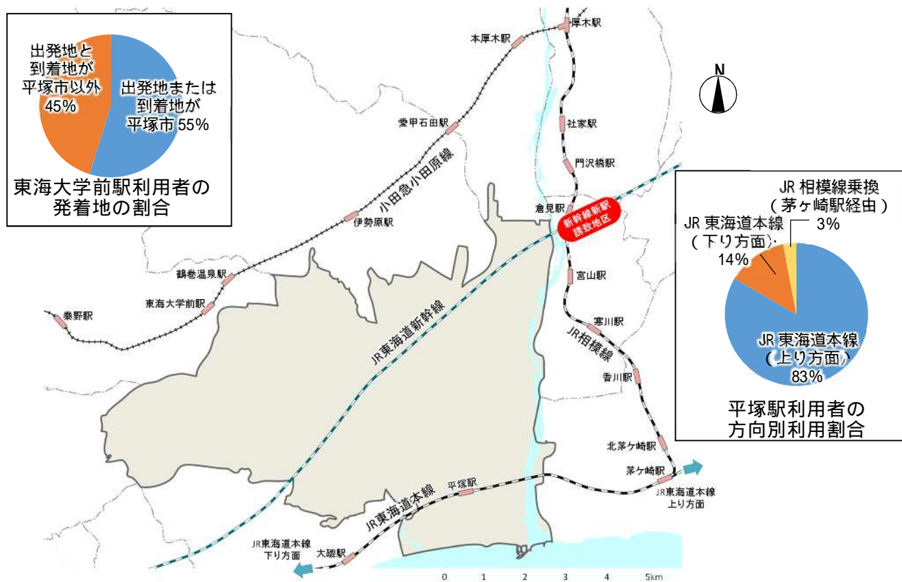
図 3.1 平塚市周辺の鉄道網