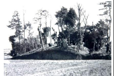
昭和38年頃の牛山古墳