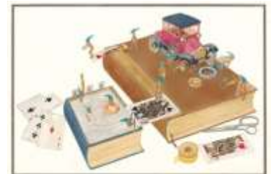
安野光雅「ふしぎなえ」1968年 空想工房

【その他】駐車場には限りがあります(有料)。ご来場の際は公共交通機関をご利用ください。