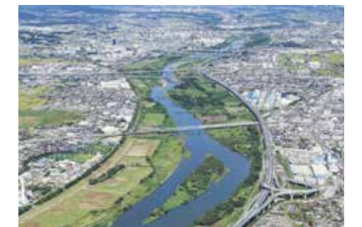
ツインシティ整備地区周辺の状況

再生可能エネルギーの導入など、環境共生モデル都市ツインシティを整備することで、魅力あるまちづくりを推進するとともに、全国や首都圏との交流連携の窓口となる東海道新幹線新駅を設置し、地域全体の活性化を図ります。