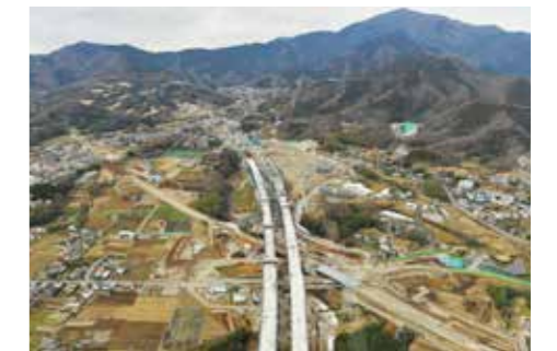
新東名高速道路 伊勢原大山インターチェンジ

新東名高速道路や横浜湘南道路及び厚木秦野道路(国道246号バイパス)などの整備促進や(都)湘南新道の整備などの道路網の整備を進めるとともに、スマートインターチェンジの整備促進など道路網の有効活用にも取り組みます。また、JR東海道本線の村岡新駅(仮称)の実現に向けて取り組みます。