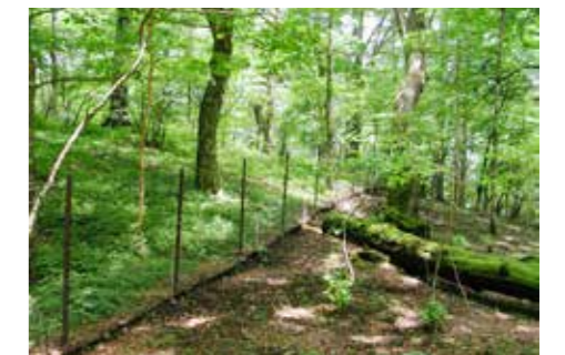
土壌保全対策による植生回復状況

丹沢大山では、植生保護柵の設置などの土壌保全対策やニホンジカの管理捕獲、これまでの技術開発の成果などを活用したブナ林の保全・再生対策、県民との連携・協働による登山道整備などを進めることで、自然の再生を図ります。