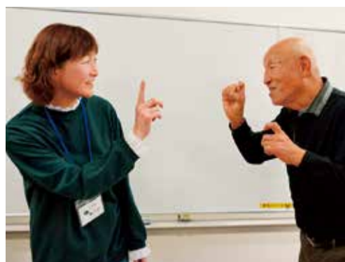
福山会長(写真左)は中級コースに参加。講師と手話を確認し合います