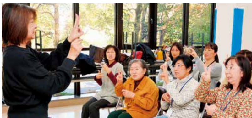
講師のお手本を見ながら手話を実践する入門コースの参加者

毎年2回、初心者手話講習会を開いている同サークル。入会するのはその講習会の受講者か、手話の経験者、そしてろう学校に通う児童・生徒の保護