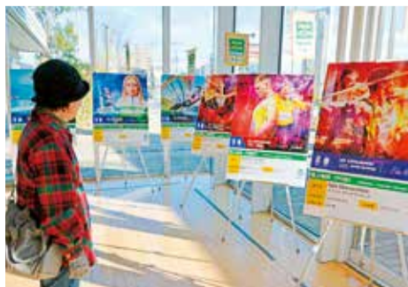
「選手の名前を覚えておきなさい」とパネルに見入る来場者