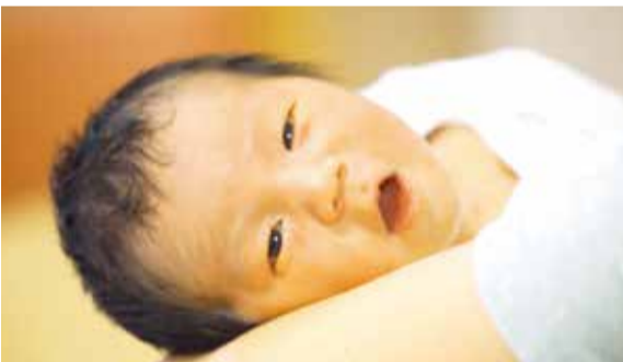
温かいご支援、ありがとうございます

温かい人が暮らし、今回のような取り組みを応援していただける平塚を、さらにやさしくあふれる手をつなぎたい。今年もさまざまな取り組みを加速させていきます。