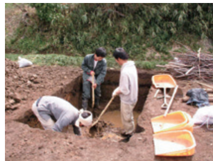
平成16年 牛山古墳の調査 (平塚市文化財調査報告第35集 平塚市教育委員会 平成20年（2008年）3月)

時代は下りますが、『続日本後記』、『日本三代実録』といった六国史に承和七年（840年）から貞観元年（854年）にかけて、相模国大住郡大領（郡司）壬生直（みぶのあた）広主が窮民を救済したことによる叙任記事がみえ、また、対岸の高座郡司として承和八年（841年）に壬生直黒成が同じく窮民を救済していません。相模川を挟んで両岸に壬生氏の一族が郡司として勢力を持っていたのです。このように、少なくとも古墳時代から平安時代には相模川流域交流圏というべき地域圏が行政単位の郡とは別に成立し、河川交通をとおして活発に活動していたことを知ることができそうです。ちなみに、窮民の救済の原因は、相模川の氾濫ではないかと考えていますが、記事にはなにも書かれていません。考古学的な調査がこうした疑問を解決してくれるかもしれません。