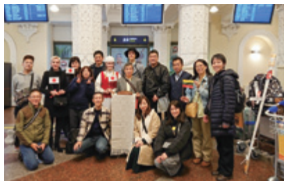
カウナス市教育関係者による出迎え

私たち七夕太鼓は、過去にもアメリカや韓国で演奏してきましたが、奇しくも最後の海外公演が24年前のリトアニアでした。リトアニアとの縁を感じざるを得ません。