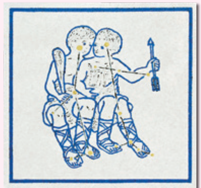
ふたご座の星座絵タイル