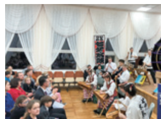
アリートゥス音楽学校での公演

最後に私たちの滞在中の移動や、太鼓の運搬などのお世話をいただいたカウナス市の教育委員会の方には大変感謝しています。またリトアニアに行きたいと願っている次第です。