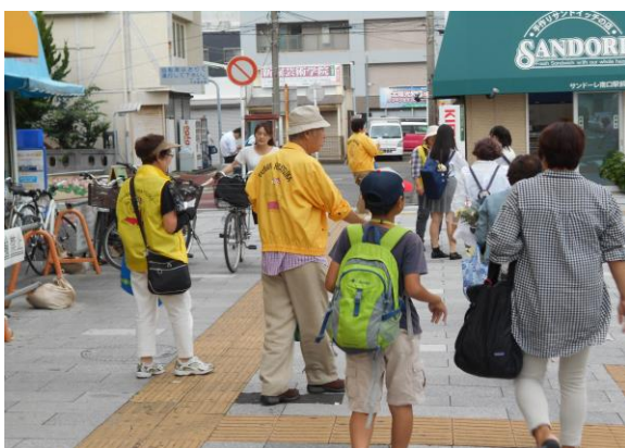
生ごみ水切りキャンペーン