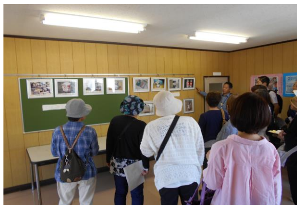
市内ごみ処理施設見学会