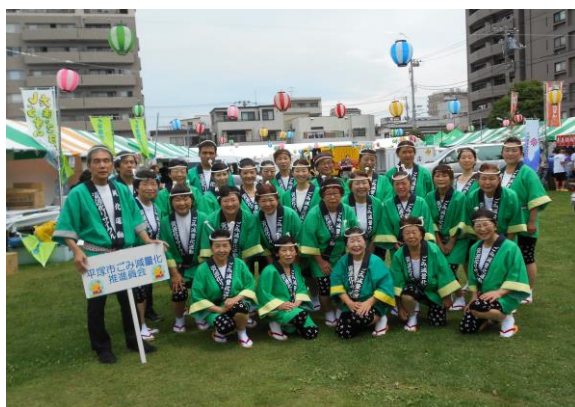
七夕踊り千人パレード