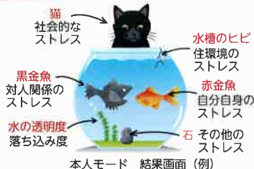
本人モード 結果画面 (例)

こころの体温計 ご利用にあたって ・利用料は無料です。(通信料は、自己負担となります。) 個人が特定されるような情報の入力は一切不要です。 ・自己診断をするもので、医学的診断をするものではありません。 ・結果にかかわらず、心配なことが続くようでしたら、早めに専門家に相談されることをおすすめします。