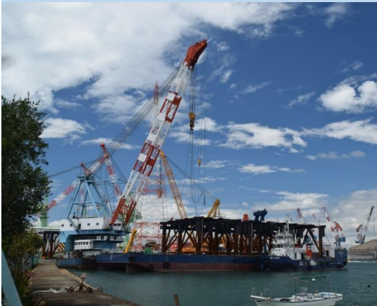
川田技報 Vol.35 より

川田工業は得意とする鋼構造物の製作技術を利用し、かねてより漁港や港湾に設置される海洋ジャケット（鋼構造部材で構成される栈橋）を製作してきました。この研究会に参加するきっかけは、東京大学生産技術研究所と参画する企業の方が当グループ発刊の「川田技報」に書かれた海洋ジャケット構造物の記事をご覧になって、声をかけていただいたことが始まりでした。「皆さんも地球防衛軍に参加しませんか？」と。