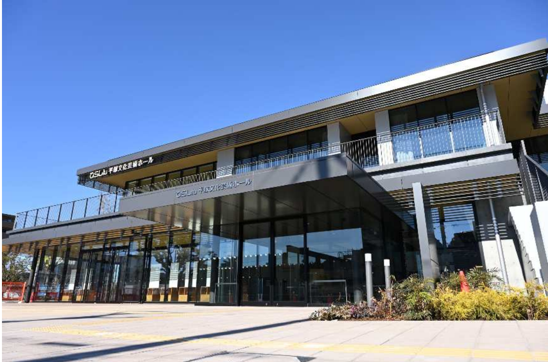
ひらしん平塚文化芸術ホール