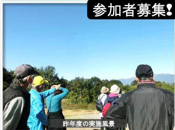
昨年度の実施風景