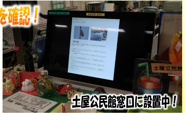
土屋公民館窓口に設置中！

▶ 放映して欲しい写真や動画がありましたら公民館へご連絡ください。(58-0833)