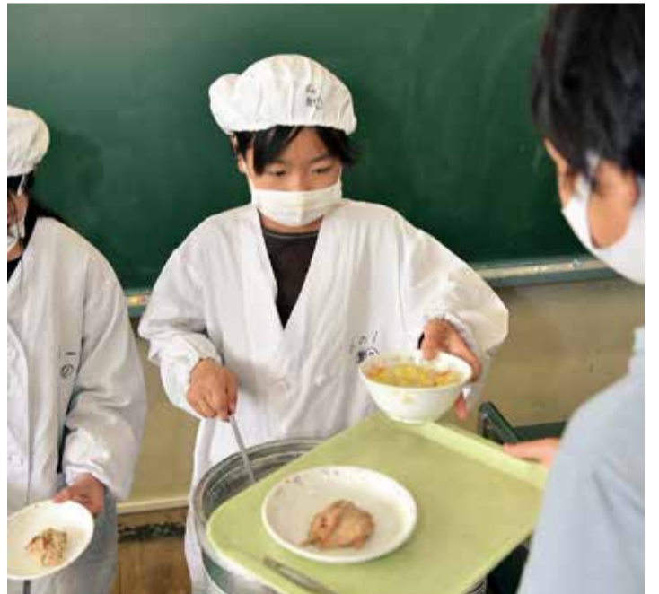
地元の食材を多く使った安心でおいしい給食の提供を続けていきます