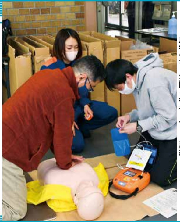
座学の後、実際に機材を使った訓練もします

☎ 必要事項・性別・生年月日、電話・アクセス・メールで、生きがい事業団☎33-2335 FAX35-1744 代表 ikgai@ma.scn-net.ne.jpへ。