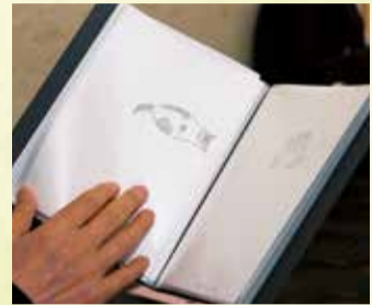
見た日付も一緒に記されています

ただ、幻視の症状は頻繁にあり、自分のために記録しておこうと絵を描き始めたといいます。幻視の症状が出るのは朝目覚めた時。「目を開けると、天井や壁にポンと浮かんでくるんです。そのまま消えることもあれば、移動したり、大きくなったりすることもありますね。見えたものを見たまま描き、ファイリングしています」。見えるのは平面でモノクロのものが多いのですが、たまに立体的でカラーのものも。「幻視といわれると怖いものを見るというイメージがあったのですが、私の場合はあまり怖いものではなくて。子どもの頃、兄とよく遊んだトランプがモチーフになっていたり、最近見た映画に出てきた生き物だったり。見たことがないと思っているものも、ただ忘れていただけでどこかで見ていたのかもしれない、なんて考えています」とほほ笑みます。