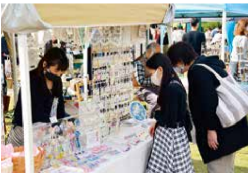
平塚の魅力が詰まった青空市です