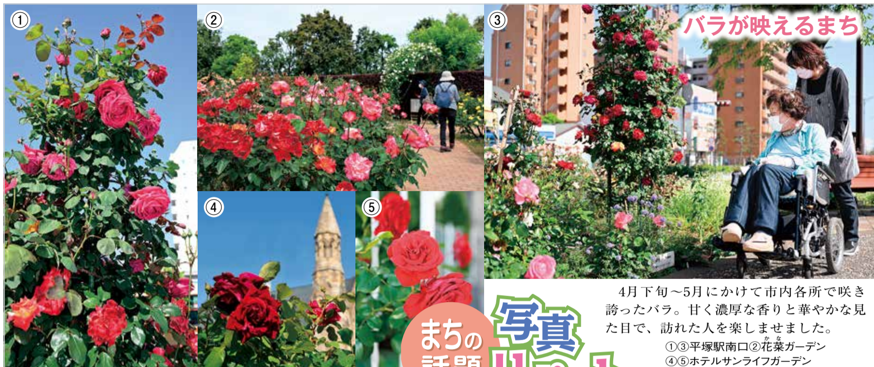
バラが映えるまち

4月下旬～5月にかけて市内各所で咲き誇ったバラ。甘く濃厚な香りと華やかな見た目で、訪れた人を楽しませました。