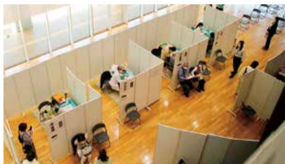
集団接種を5月15日に始めました

「ばらの香りにウクレレのせて」をテーマに、ウクレレの美しい音色と歌声が響いた同会。訪れた人は、「百万本のバラ」「愛は花、君はその種」などの懐かしのメロディーに聞き入っていました。