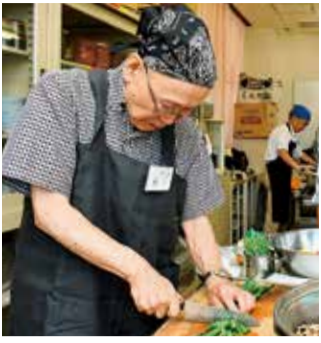
手軽に作れる料理を教えます

午。福祉会館。市内在住の60歳以上の男性で、料理初心者の方6人(抽選)。エプロン・三角巾・布巾・タオル・筆記用具。1000円。