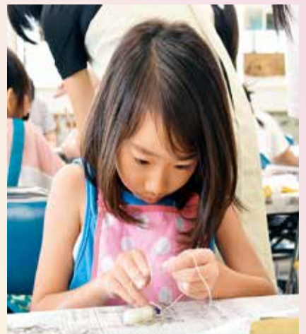
オリジナルの勾玉を作ってみませんか

午前9時30分〜正午。埋蔵文化財調査事務所。市内在住・在勤・在学の小学校3年生以上の方、各コース14人(抽選)。軍手・筆記用具・不用な布・タオル、お持ちの方はエプロンまたはスモック。250円。汚れてもよい服装でお越しください。