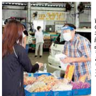
市の名産品もあります