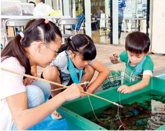
ザリガニ釣りの教室もあります

地球温暖化の防止をテーマに、市民活動団体や大学などが、ソーラーオルゴールの工作や、安全な材料を使った入浴剤作りなど、環境のことを楽しく学べる環境教室を開きます。