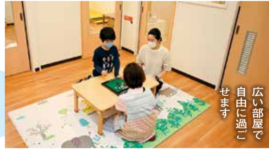
広い部屋で自由に過ごせます

病児保育室の利用には事前登録・予約・病院の受診が必要です。詳しくはお問い合わせください。