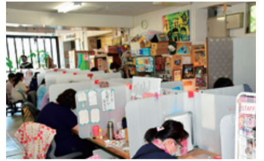
作業スペースにも作家の個性が出ています

「好きなことや得意なことを活かした仕事ができるようにサポートしています」と話します。