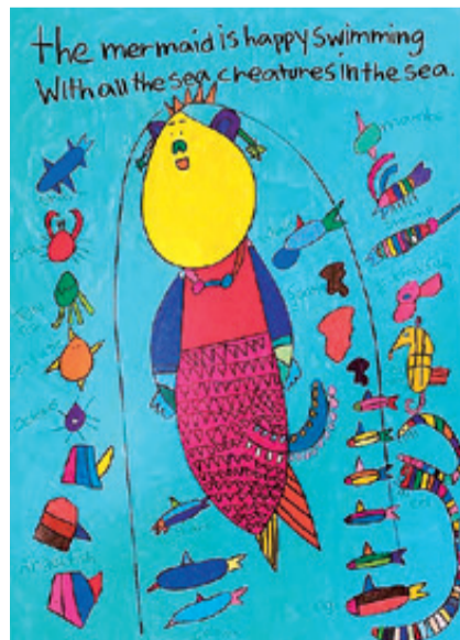
池田ジャスティーン「ザ マーメイド イズ」(令和元年)