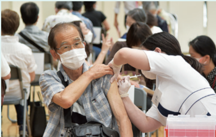
6月21日、市役所で平日の集団接種が始まりました。 毎日およそ1,500人が接種を受けています