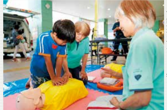
心肺蘇生の方法なども学べます