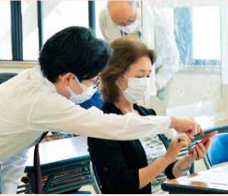
1人1台、端末を貸し出します

9月6日～14日の月・火曜日と17日(金)、午前10時30分～午後1時30分(各1時間)。福社会館。市内在住で、スマートフォンを持っていない方、各回6人(先着順)。 必要事項・年齢を、電話・ファクス・メールで、 生きがい事業団 ☎33-2335☎35-1744☎h-ikigai@ma.scn-net.ne.jpへ。