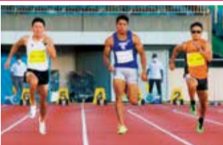
オリンピックも走りました

湘南ベルマーレのホームスタジアムです。Jリーグの公式戦以外にも、全日本クラスの陸上大会をはじめ、数多くの大会などで使われています。天然芝インフィールドが多くのプロサッカー選手から評価されるなど、抜群のプレー環境が自慢です。