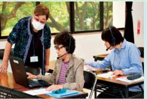
録音図書を作成するための講習です

パソコンを使って、視覚障がい者向けの録音図書を作成する方法などを学びます。9月28日〜10月26日の火曜日、全5回、午後1時〜3時。福祉会館。自宅で音訳し、録音・編集ができる方15人(先着順)。筆記用具。500円。☎ 電話または直接、8月23日(月)午前9時から、福祉会館 ☎33-0007へ。