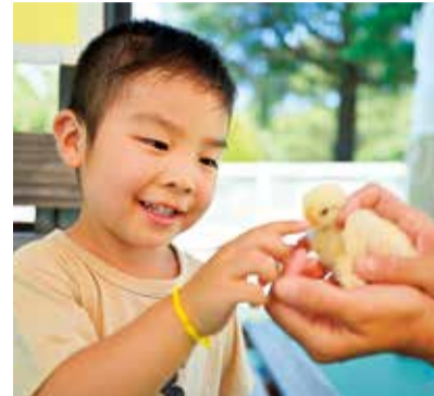
ヒヨコなども触れ合えます