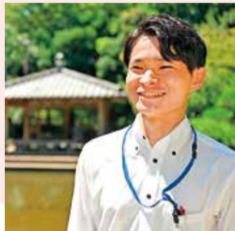
問 総合公園管理事務所 ☎35-22233

同公園は市内の中心部にあるため、散歩や休息などで気軽に来られることが人気の秘訣だといえます。園内で多く見掛ける子どもや大人の笑顔は、人気の高さを象徴するかのようです。