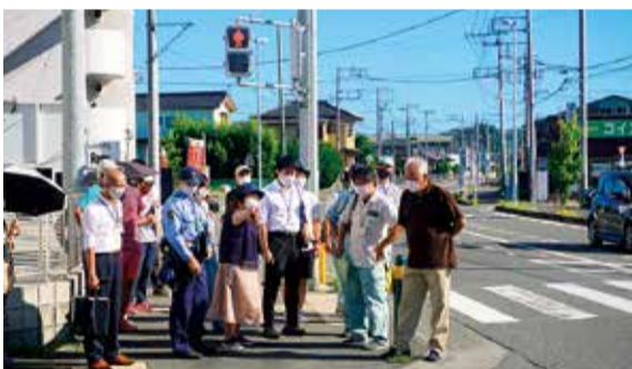
地域住民の協力も得て通学路を合同点検

美術館の企画展「studio COOCAのパッパパラダイス2021 これがつとめてとくいです」を9月12日(日)まで開いています。オリジナリティーあふれる作品、約300点を展示。表現することの楽しさを感じてみませんか。