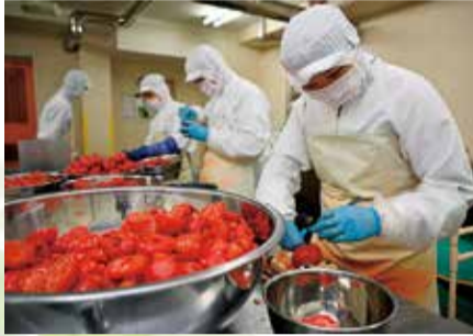
機械化はせずに、利用者ができる作業の場を大切にします

部品組み立て以外に、特徴的な作業の一つが農産品加工です。平成20年のリーマンシヨックで部品組み立ての受注が激減。そこで利用者の雇用を守るため、県内で初めて、小さい単位で加工の受託ができる小ロットの農産品加工を始めました。原材料は生鮮品として商品とならなかつた、地元農産物を使っています。代表的な商品は市の名産品にもなっている、糖度7度以上と自然な甘さが魅力のトマトジュース。トマト以外