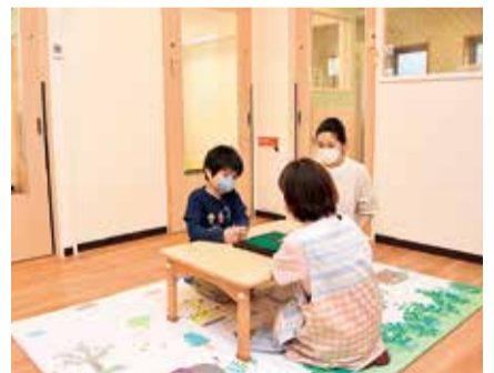
本市初となる病児保育の施設整備を支援しました

※金額は表示単位未満で四捨五入して1万円単位にしています。このため、合計が合わないところがあります。