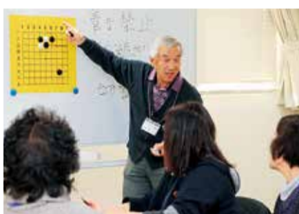
囲碁のルールを丁寧に教えます

■ まぢづくり財団 〒254-0045 見附町31-10 ☎32-2237 ㊟32-2240 12月15日～令和4年3月 2日の水曜日、全10回、午前