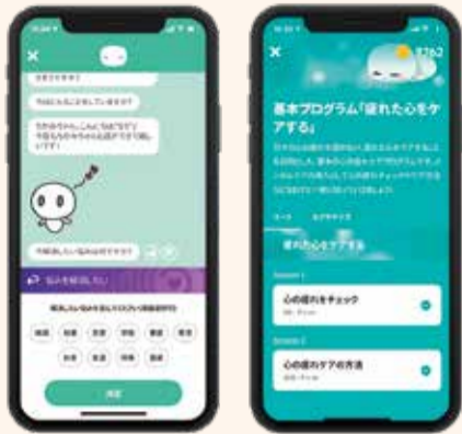
AIチャットボットで悩みを相談でき、心をケアするプログラムも実践できます

募 emolのウェブで、お申し込みください。右上の2次元コードからアクセスできます。問い合わせは健康課 ☎55-2111へ。