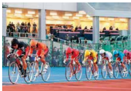
ケイリン KEIRINグランプリ2020を開催しました

た。新型コロナ対策のため、無観客での開催が15日あったものの、4万3447人が来場しました。一般会計に3億円繰り出しました。収益金は、オリンピック・パラリンピック推進事業や消防車両整備事業などに充てられています。 国民健康保険事業 一般会計から19億6816万円を繰り入れました。歳入に占める保険税収入済額の、