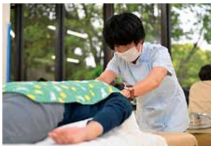
心と体をすっきりさせませんか

家族介護リフレッシュ 腰痛肩こり予防プログラムで日頃の疲れを癒やしませんか。介護者同士の交流もできます。市内在住で、家族を介護している方。抽選。 ①12月9日(木)午前9時30分～午後0時30分。リフレッシュプラザ平塚(大神3344-4)。6人②10日(金)午前9時30分～午後0時30分。福祉会館。9人③10日1時30分～4時30分。福祉会館。9人