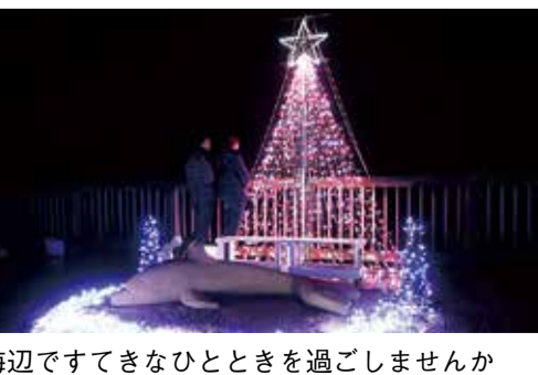
海辺ですてきなひとときを過ごしませんか