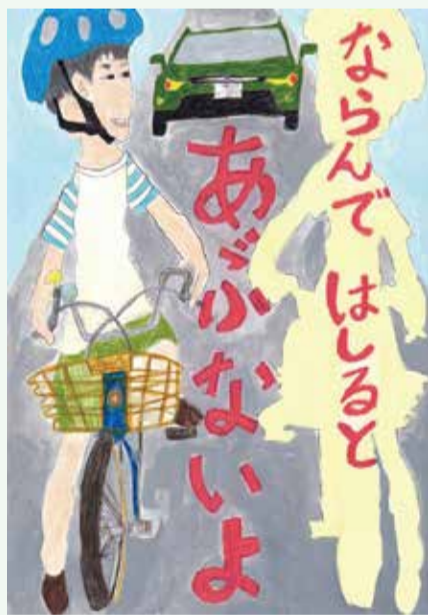
令和3年度最優秀賞作品 「ならんではしるとあぶないよ」

手作り雑貨やアクセサリが並び、キッチンカーで作った料理やライブ演奏が楽しめる、平塚の魅力が詰まった青