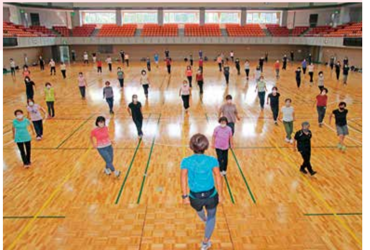
(右)通常200人の定員を半分に減らし、ソーシャルディスタンスを保っています(左上)アップテンポな音楽に合わせてリズムカルに動きます(左下)近所の友人同士2人で通い始め、会場で知り合った人とも友達になったそうです。今では3人で一緒に参加しています

マスクを着用していない写真は、十分な距離を取るなどの対策を講じた上で、一時的に外して撮影したものか、新型コロナウイルス感染症の流行前に撮影したものです。