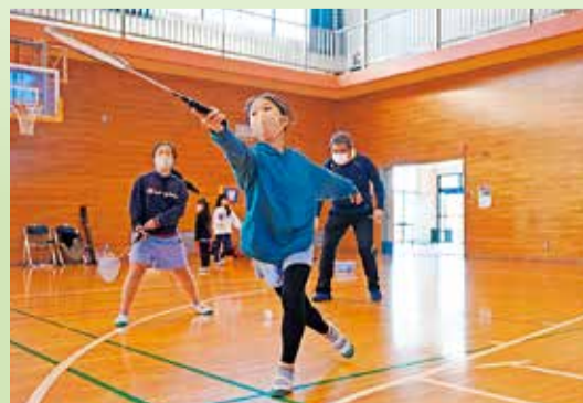
跳び箱とバドミントンが特に人気です