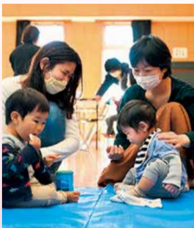
親子で一緒に交流します