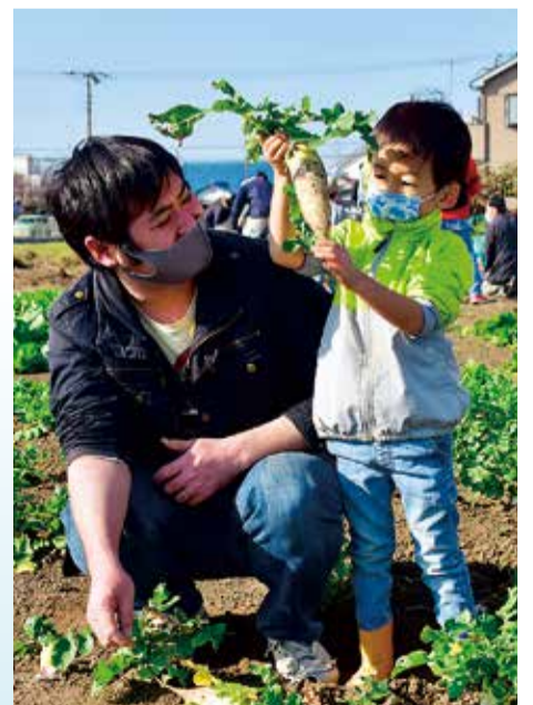
▲自分で育てた野菜を収穫します