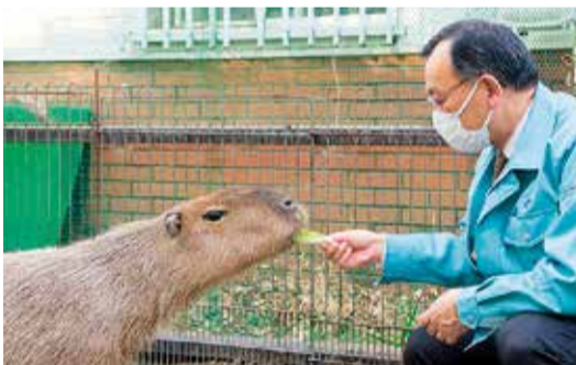
公開後には名前を公募する予定です

◎集団接種会場の公民館 集団接種をしている日の午前9時30分～午後4時30分。2月は神田公民館(田村3-12-5)と金目公民館です。