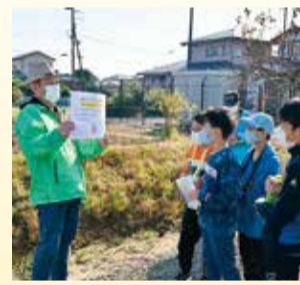
チェックポイントでは地域の歴史を学べる問題を出題

毎年、小学校区単位で開かれる地域の一大イベント、地区レクリエーション大会(地区レク)。しかし新型コロナの影響で、令和2・3年度と続けてほとんどどの地区で中止となりました。厳しい状況の中、横内地区では地形などの特性を生かして、ウオークララー形式での地区レク開催に成功。背景には地域のつながりを大切にしたいという思いがありました。