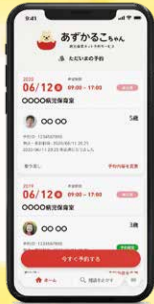
イメージ画像です