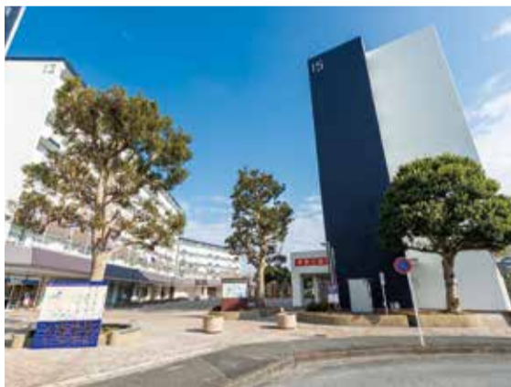
JR東海道線「平塚」駅 バス20分 徒歩1~3分

※1 最長5年間最大5%家賃減額。 ※2 一定の条件がありますので、お問い合わせください。住戸内写真は一例です。