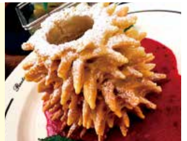
伝統的な焼き菓子「šakotis」