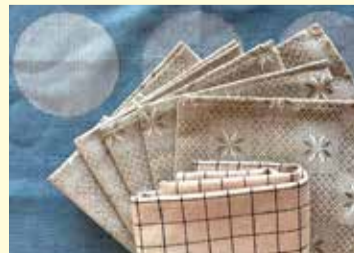
さまざまな柄のリネン雑貨

リトアニアでアマを生産し始めたのは4,000年ほど前 で、衣食住の全てにおいて重要なものです。アマニやア マニ油は栄養価がとても高く、民間療法や伝統医学で昔 から使われています。また、アマで作られた生地である リネンは、民芸品にもなるほどの質の高さを誇ります。 リトアニアのリネンは国外でも良質のものとして知ら