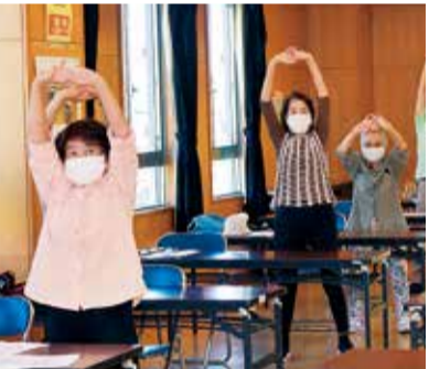
認知症予防運動のヨガニサイズを体験します

募集 電話で、土・日曜日と祝日を除く各開催日の3日前までに、福祉会館 ☎33-3100へ。