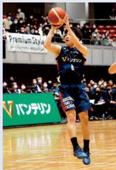
プロのハイレベルな試合を楽しめます

横浜ビー・コルセアーズ対秋田ノーザンハピネッツ。 3月9日(水)午後7時5分試合開始。トッケイセキュリテイ平塚総合体育館。1,100人(先着順)。チケットはBリーグクラブチケットなどの各プレイガイドで販売。市内在住の小学生はドリームパスポートを使って無料で観戦できます。各席の料金など、詳しくは横浜ビー・コルセアーズ公式ウェブをご覧ください。