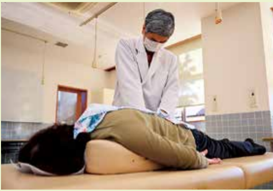
日頃の疲れを癒やします

腰痛肩こり予防プログラムで、体と心をスッキリさせませんか。市内在住の、家族の介護をしている方。抽選。