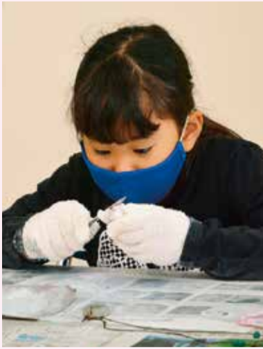
淡いピンク色のサクラ石を削って作ります

3月28日(月)・29日(火)、午前9時30分〜正午。埋蔵文化財調査事務所。市内在住・在勤・在学の小学校3年生以上の方、各日18人(抽選)。軍手・筆記用具・不用な布・タオルなど、お持ちの方はエプロンまたはスモック。350円。汚れてもよい服装でお越しください。