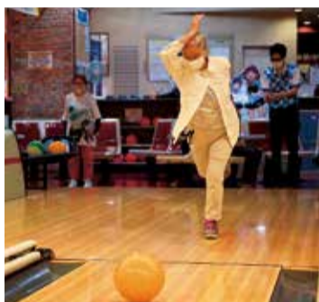
初心者向けの教室です