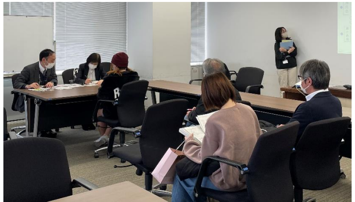
事業所職員と個別でお話できます