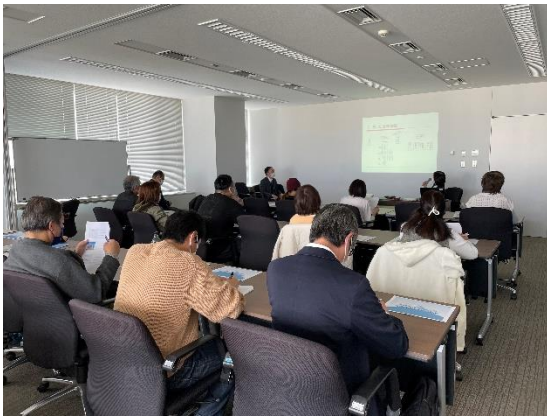
事業所職員から説明

法人の職員から直接話を聞くことができるだけでなく、希望者は後日介護事業所を訪問し、事業所見学をすることができます。