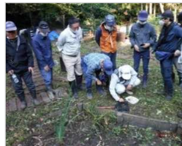
ヤゴ生育観察の様子