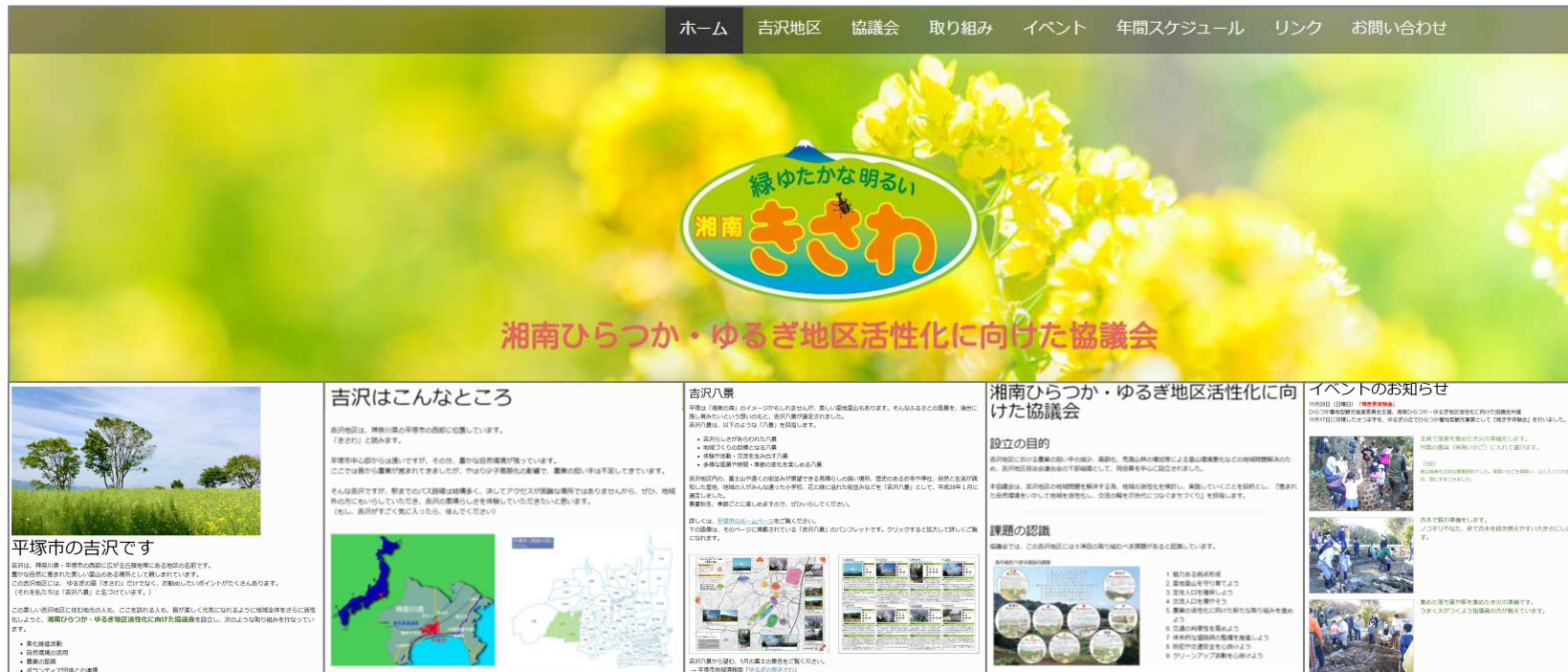
ホームページの一部内容

今後、ゆるぎ地区等の紹介、本協議会活動の取組み、各種イベントのお知らせ・募集受付等を行い、本協議会を地域内外等にアピールしてまいります。