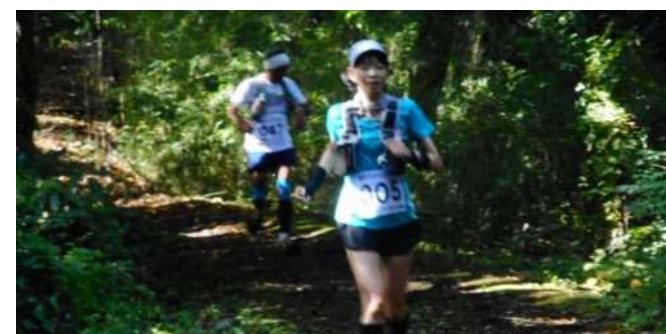
過去のレース中の様子（ゆるぎ地区内）