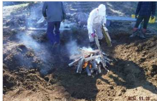
焼き芋用焚き火の様子