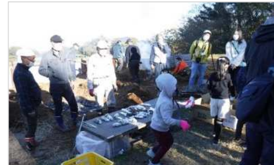
焼き芋出来上がりの様子