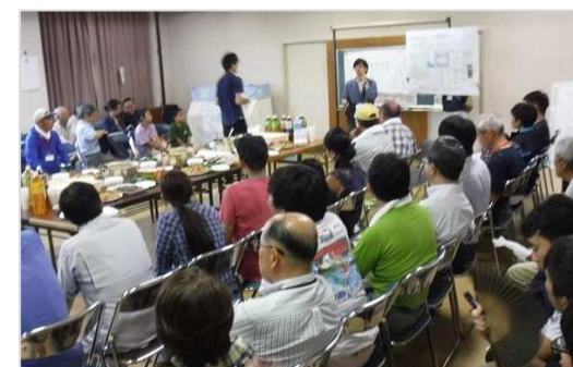
近年のワークショップ活動の一コマ