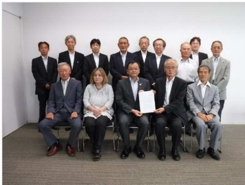
落合市長との面談

市長面談後には、平塚市まちづくり政策部まちづくり政策課との面談を行い、本協議会の活動内容や成果等を報告し、吉沢地区の活性化に向けての要望等資料における各課題に関し、市と検討状況・課題等について意見交換を行いました。