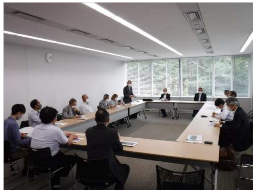
まちづくり政策課との面談