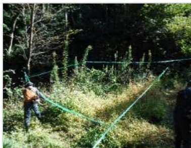
刈払機械除草作業の様子