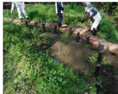
池止水板補強の様子