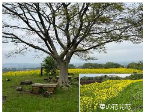
ゆるぎの丘と菜の花畑