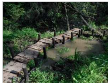
池止水版補強完了