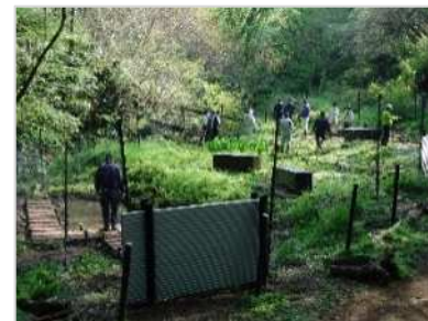
トンボの里と周辺