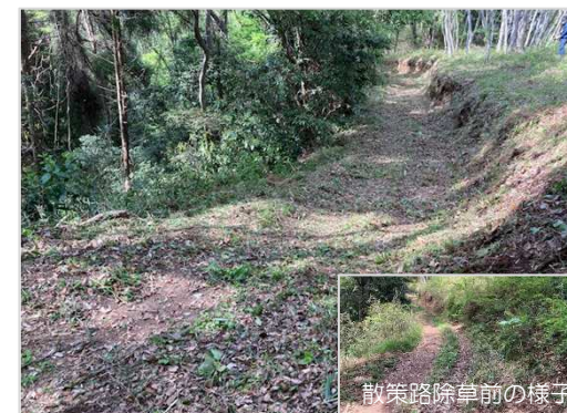
下吉沢展望所の散策路除草後の様子