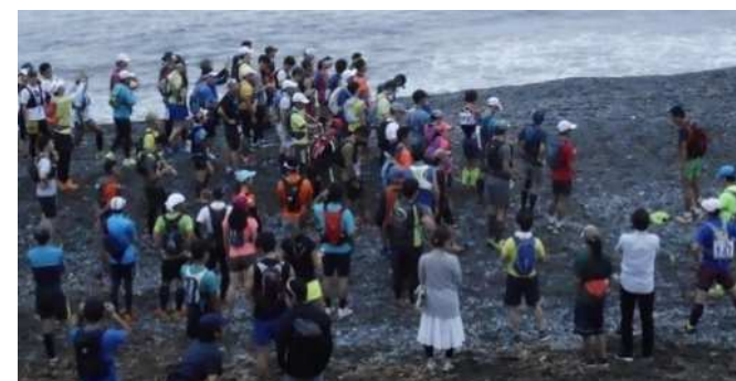
過去のトレイルランのスタート地点の様子