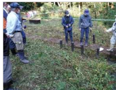
ヤゴ生育説明の様子