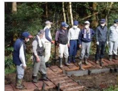
川沿いの池づくり完了