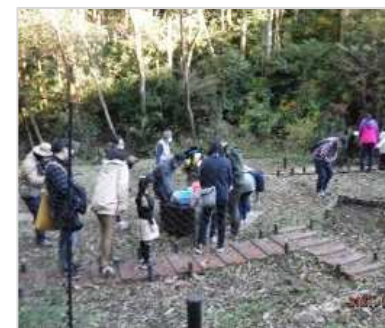
トンボの池での育成観察