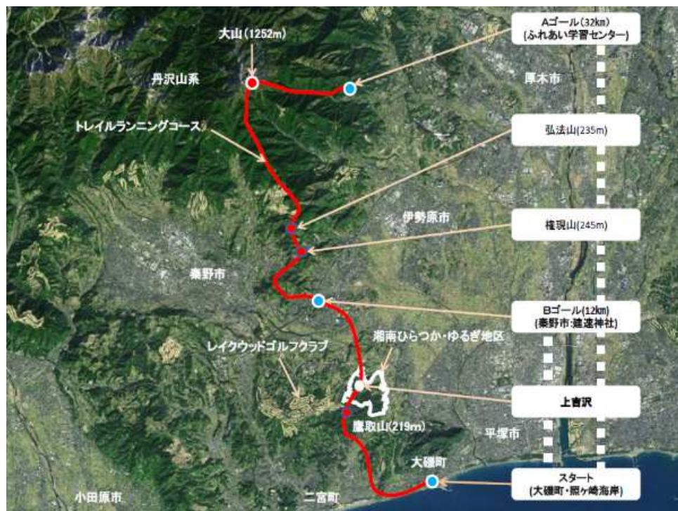
(青鳩トレイル大磯～大山大会 コース図)

第1回大会からボランティアで運営を協力している上吉沢自治会、吉沢地区安全協会等がランナー誘導や交通整理などでボランティア活動に協力し、本協議会では事前に当大会コースの除草整備を行ってきましたが、今後、当大会主催者側から連絡次第、臨機に対応して行くことと致します。