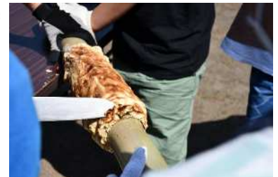
グループで協力して、1つのバウムクーヘンを作ります