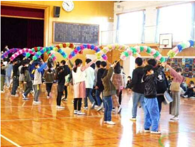
卒業おめでとう集会(2月28日)

それぞれの学年も、進級の日が近づいています。いいスタートが切れるように、心の準備をしてほしいと願っています。