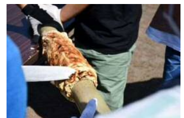
グループで協力して、1つのバウムクーヘンを作ります