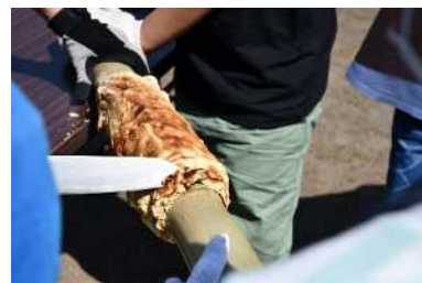
グループで協力して、1つのバウムクーヘンを作ります