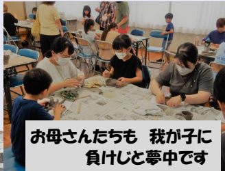
お母さんたちも 我が子に 負けじと夢中です