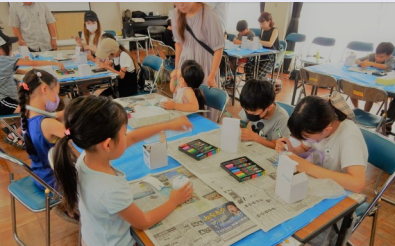
風鈴に色付け、センスが問われる？