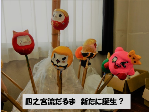
四之宮流だるま 新たに誕生？