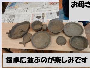
食卓に並ぶのが楽しみです