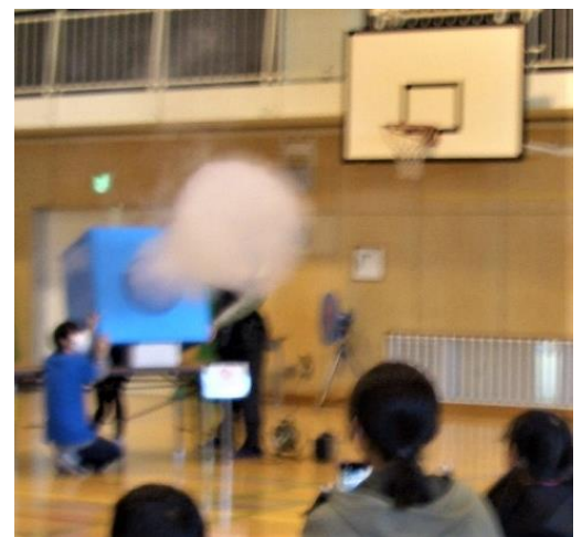
空気砲体験の様子↑