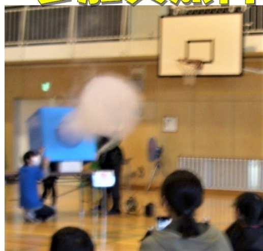
空気砲体験の様子↑

科学の実験を親子で体験してみませんか? 楽しい数々の科学実験や大きな空気砲を飛ばす 体験ができます!それぞれのブースで、東海大学の 学生が分かりやすく解説してくれます。