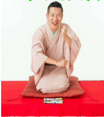
講師：林家 木久蔵氏 (はやしや きくぞう)