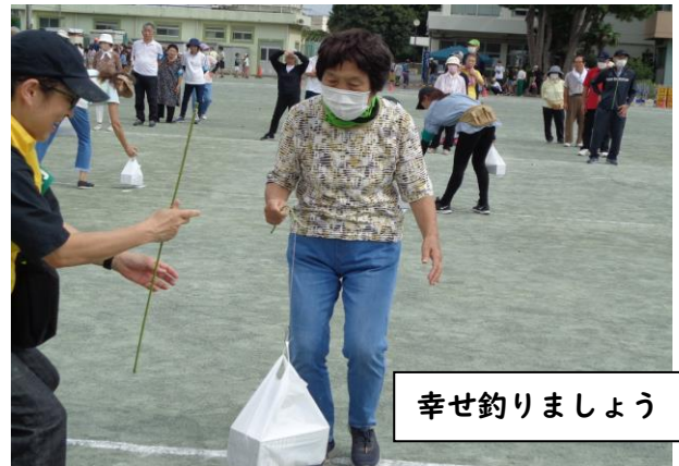
幸せ釣りましよう