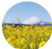
吾妻山公園(二宮町)