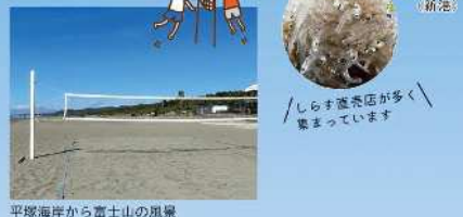
平塚海岸から富士山の風景