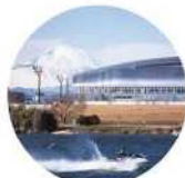
馬入大橋周辺(平塚市)