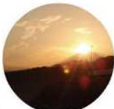
照ヶ崎海岸(大磯町)