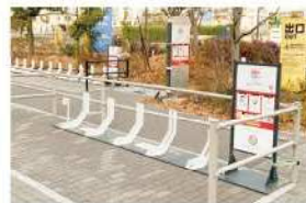
シェアサイクルポート