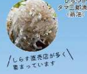
しらす産店が多く集まっています