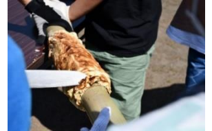
グループで協力して、1つのバウムクーヘンを作ります

親子で協力して竹を使ったワイルドなバウムクーヘンを作ります。 楽しいひとときを過ごしなが、親子のふれあいを深めてみませんか?