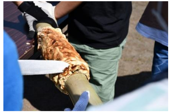
グループで協力して、 1つのバウムクーヘンを作ります