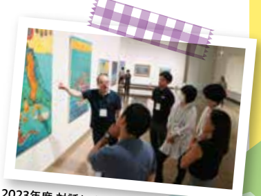
2023年度 対話による美術鑑賞体験