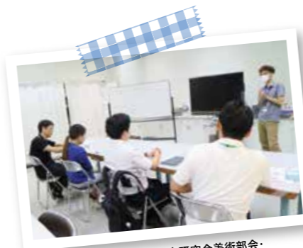
2023年度 伊勢原市中学校教育研究会美術部会・研修会風景