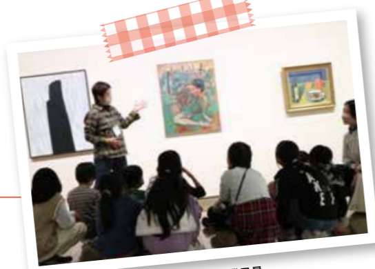
2023年度 対話による美術鑑賞・来館授業風景

美術館の普段見られない場所を見ながら機能や役割について学ぶツアーです。 (このプログラムには人数制限がございます。)