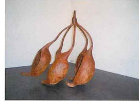
中嶋明希《めをつける》 2016年 作家蔵