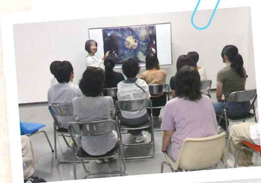
2025年度 対話による鑑賞体験会風景