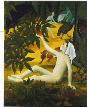
工藤甲人《愉しき仲間(一)》 1951年 当館蔵