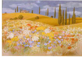
郷文子《トスカナの花野》 1990年 当館寄託