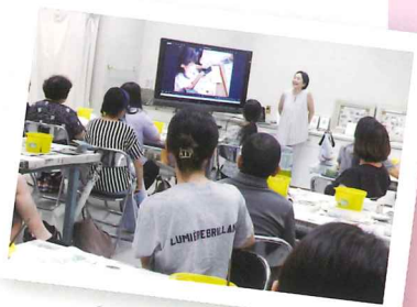
2025年度 教員向け実技講座風景