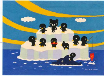
たかいよしかず 《くろくま ペンギンワールド》 2012年 作家蔵

■ 6/27(土)~9/6(日) 絵本作家たかいよしかずの Happy World in HIRATSUKA