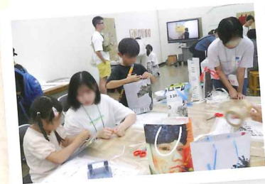
中高生ボランティア活動風景