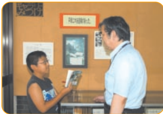
木谷さんて、すごーい

集まった子どもたちの一日はとってもすごいんです。まず朝六時に起きて、ラジオ体操。次に強い人の打った碁を実際に碁盤に並べてみます。こうすると強くなるそうです。それが終わってやっと朝ごはん、そして学校です。学校は花水小学校に通いました。帰ってきて、また囲碁の勉強です。こんなにがんばっても、プロに