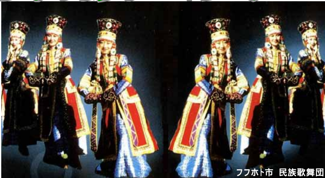
フフホト市 民族歌舞団