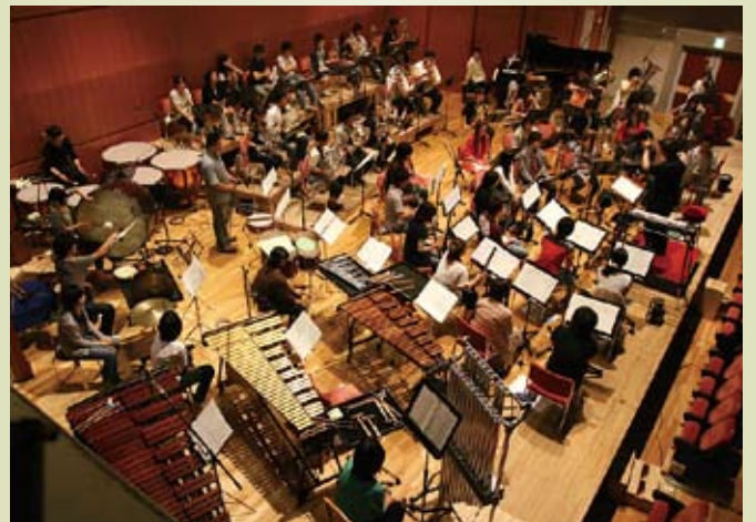
レコーディング風景

そして現在、作品集第2弾を始め新作CDの制作、海外での演奏会、出版、などまた新しい世界へと踏み込もうとしています。私はこれからも音楽を書き続けて行くと共にさらに音楽の素晴らしさを知るために勉強をして行く事と思います。私の音楽活動の始まりとなった平塚に今後も『音楽』で貢献出来るように頑張っていきたいと思っております。