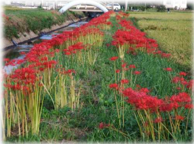
秋に見事に咲いた曼珠沙華（彼岸花）