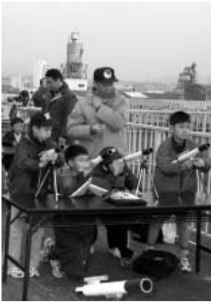
博物館屋上での天体観察会