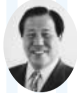
吉野 稜威雄 市長