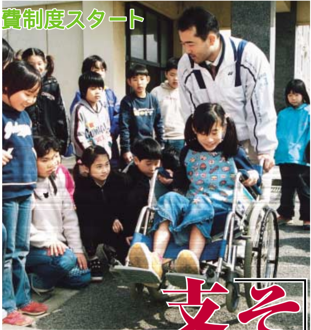
総合的学習の時間に車いすを体験。福祉の心がはぐくまれています。(大野小学校4年3組)