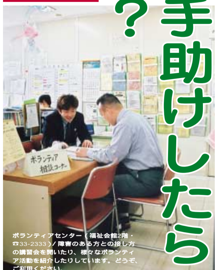
ボランティアセンター(福祉会館2階・☎33-2333)/障害のある方との接し方の講習会を開いたり、様々なボランティア活動を紹介しています。どうぞ、ご利用ください。

若い人、お年寄り、障害のある方、障害のない方。まちにはいろいろな人が暮らしています。ふれあいのないまちでは、障害のある方は孤独になりがちです。しかし、だれもが心温まるふれあいや手助けをすることができれば、孤独にならなくて済むのではないのでしょうか。 障害のある方がまちで困っている姿を見かけたとき、障害のない方はどのような行動をとればよいのでしょうか。今回は、ボランティアで活躍している方々のお話とともに、障害のある方との接し方を紹介します。