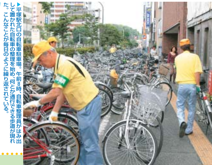
平塚駅北口の自転車の整理。午前8時、自転車整理員がはみ出しで置かれた自転車の整理を始め、何とか通行できる歩道が現れた。こんなことが毎日のように繰り返されている。

夏の夜の遊びといえば「花火」があります。みんなで遊んで楽しい花火ですが、場所や時間によっては周りに住む方々に大きな迷惑を掛けてしまいます。公園や公共の場所などで夜遅い時間に花火をしたり、大きな物音を立てて騒いだりすることはしてほしくないです。また、お子さんたちがそのような迷惑行為をしないよう、一度、ご家族で話し合ってください。