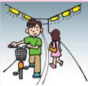
平塚駅東側の地下道でも自転車は降りて歩いてね。

今度はクイズです。「自転車は歩道ならどこでも走ってよい」答えは×です。自転車が走れるのは、「自転車通行可」の標識がある歩道だけだよ。みんな知ってたかな? それ以外の歩道では自転車から降りて歩いて歩こうね。