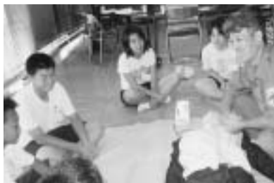
救命法の話に熱心に聞く中学生

地震への備えや救命救急の方法など、いざというとき役立つ力を身に付けよう。 ▽日時 8月7日(月)・8日(火)午前9時～正午 ▽会場 消防庁舎2階屋内訓練室ほか ▽対象 市内にお住まいの中学生 ▽定員 25人(先着順) ▽持ち物 動きやすい服装、