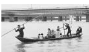
大きな川を船で横切る所を「渡し場」や「渡船場」といいます。相模川には、馬入をはじめ四之宮、田村などにあります。馬入の渡しは、東海道五十三次の宿駅ができたときの渡船場です。