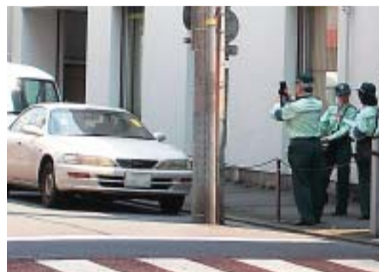
路上駐車状況(紅谷町)