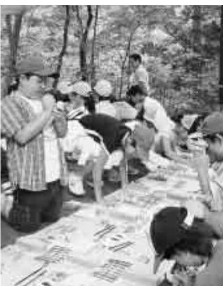
こけしの絵付けが難しいね

里山を楽しもう 谷戸で田植え体験 市民、東海大学・神奈川大学の学生と市がひとつになって、市西部の豊かな自然が残る丘陵地を里山としてよみがえらせます。今回は、谷戸で田植えをします。どうぞ、ご参加ください。 ▽日時 6月9日(土)午前9時30分～午後3時 ※小雨決行、荒天の時は10日(日)に延期 ▽場所 里山体験フィールド(土屋1076番地) ▽内容 田植え体験、谷戸で小川づくり、里山の手入れなど ▽対象 市内にお住まい、お勤め、通学している方 ▽持ち物 軍手、タオル、弁当、水筒、着替えなど ▽締め切り 6月5日(火)お申し込みは、はがき、フアクスまたはEメールで、代表者の住所・氏名・電話番号と参加者全員の氏名・年齢を、環境政策課(〒254-8686浅間町9-1・☎21-99603・kankyo-s@city.hiratsuka.kanagawa.jp・内線2605)へ。