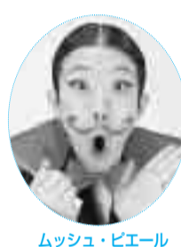
ムッシュ・ピエール(マジシャン)

する入場整理券(先着900人・1人1枚)をお持ちください。なお、開場は午後0時10分です。また、会場内でのカメラ・ビデオなどの撮影はご遠慮ください。「日産お楽しみステーション」舞台上で演じる華やかなステージマジックなどで関西を中心に活動している「ムッシュ・ピエール」や、プロフェッショナルグループパフォーマンス集団「縄☆レンジャー」が登場します。