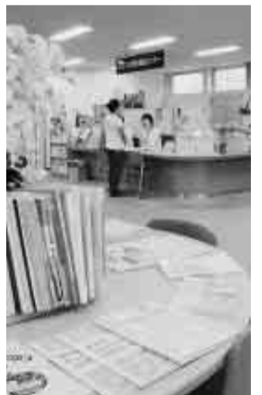
市民活動センターには市民活動に役立つ資料が整っています

・団体が交流 団体相互の情報交換や連携を助けけるために「市民活動センターまつり」を開いています(今年9月30日開催予定)