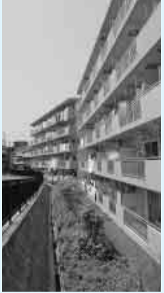
今回募集する万田貝塚住宅

お申し込みは、平塚市社会福祉協議会ボランティアセンター(追分1-43-33)へ。