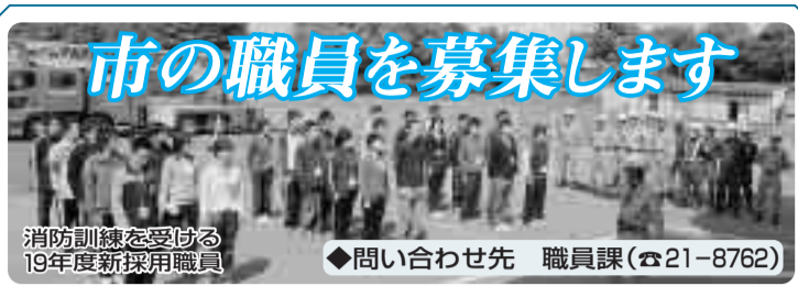
消防訓練を受ける19年度新採用職員 ◆問い合わせ先 職員課(☎21-8762)