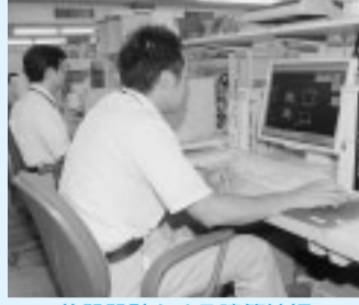
施設設計をする建築技師

▷対象 昭和54年4月2日～61年4月1日に生まれ、大学の土木・建築・電気関係の専門課程を卒業した人(平成20年3月卒業見込みを含む)