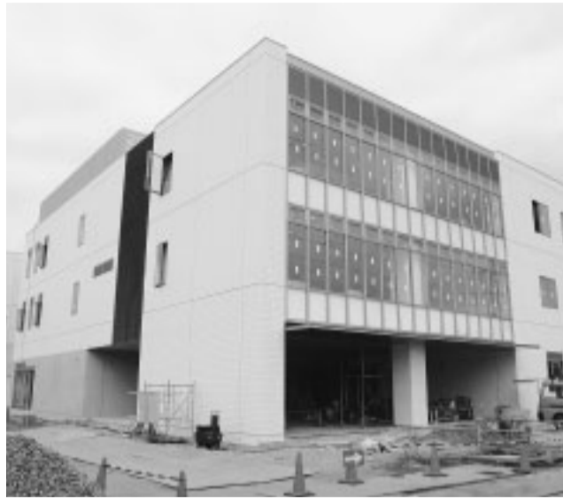
平成20年4月のオープンに向け、工事が進む新保健センター(東豊田)