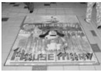
市役所本庁舎に広告入り玄関マツトを設置(平成19年度)

市民活動・情報推進など ▽着手事業数 12件中12件 ▽事業費 4億2802万円 ▽主な事業 自治基本条例の制定、ワンストップサービスの整備、電子入札システムの導入など ※事業費の1万円未満は切り捨て