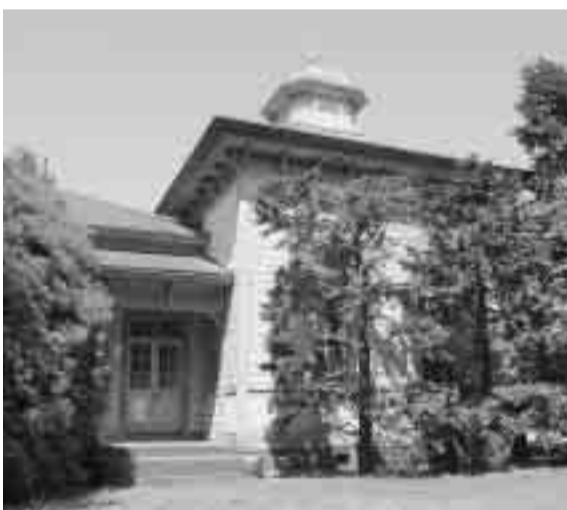
旧横浜ゴム平塚製造所記念館は、市内では唯一、 県内でも数少ない明治時代の洋風建造物です。 元々は、日本爆発物製造株式会社(株)の建物として使 用されていました。(平成16年4月撮影)