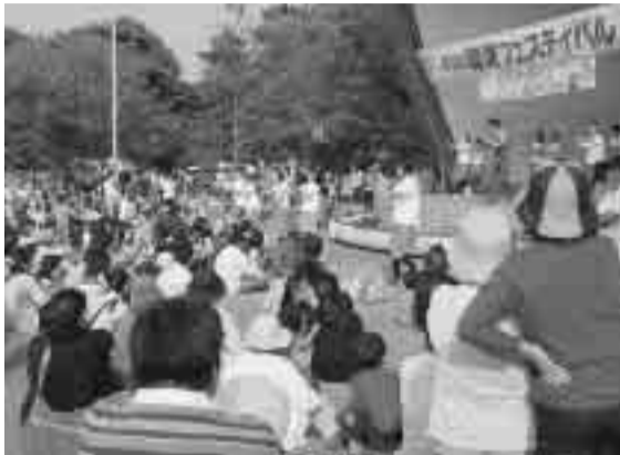
野外ステージのイベントはみんなで楽しく盛り上げられます

総合公園一帯で開催する健康フェスティバルに出掛けてみませんか。健康相談をはじめ、気軽に参加できるスポーツ体験や野外ステージで繰り広げられる楽しいアトラクション、創作ダンベル体操など、ヘルシーで楽しい催しがいっぱいです。 ◆問い合わせ先 健康課(内線2667) ■主なイベント ○健康ウォーキング2007 総合公園から立堀親水公園、鈴川サイクリングコースなど、約8キロを巡ります。 ▽集合・解散 午前8時15分集合・正午解散、総合公園野外ステージ前 ※当日朝7時直前のNHK天気予報で、午前中の降水確率50%以上の場合中止 ▽対象 小学生以上の方 ※小学生は保護者同伴 ▽持ち物 飲み物、タオル ○湘南創作ダンベル大会 課題曲に合わせた体操や、