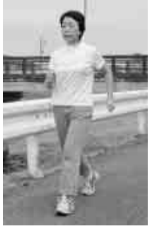
金目の観音橋付近がわたしのウォーキングコースです

このコーナーでは、平塚市生きがい事業団の会員として、元気に活動している方の健康の秘けつを紹介しています。事業団では、会員を募集しています。詳しくは生きがい事業団(☎33-2335)へ。