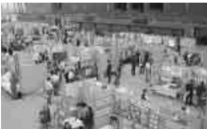
企業のブースなどが多数出展します

創作ダンベル体操の発表などで盛り上げられます。 ▽時間 午前10時～午後2時30分 ▽会場 総合体育館 ○スポーツ&ベビーフリーマーケット スポーツ用品などのリサイクル品を販売します。 ▽会場 平塚競技場南側と親水広場付近 ★同時開催 福祉フェスティバル ミニ運動会や手作り体験教室などが楽しめます。 ▽時間 午前10時～午後3時 ▽会場 平塚のはらつか ▽問い合わせ先 社会福祉協議会(☎33-2333)