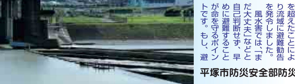
平水時の相模川寒川取水堰。台風9号による大雨で増水した相模川。9月7日午前9時ごろ。

今回の台風では、相模川の水位が避難判断水位を超えたことにより、流域に避難勧告を発令しました。風水害では、「まだ大丈夫」と自己判断せず、早め避難することが命を守るポイントです。もし、避