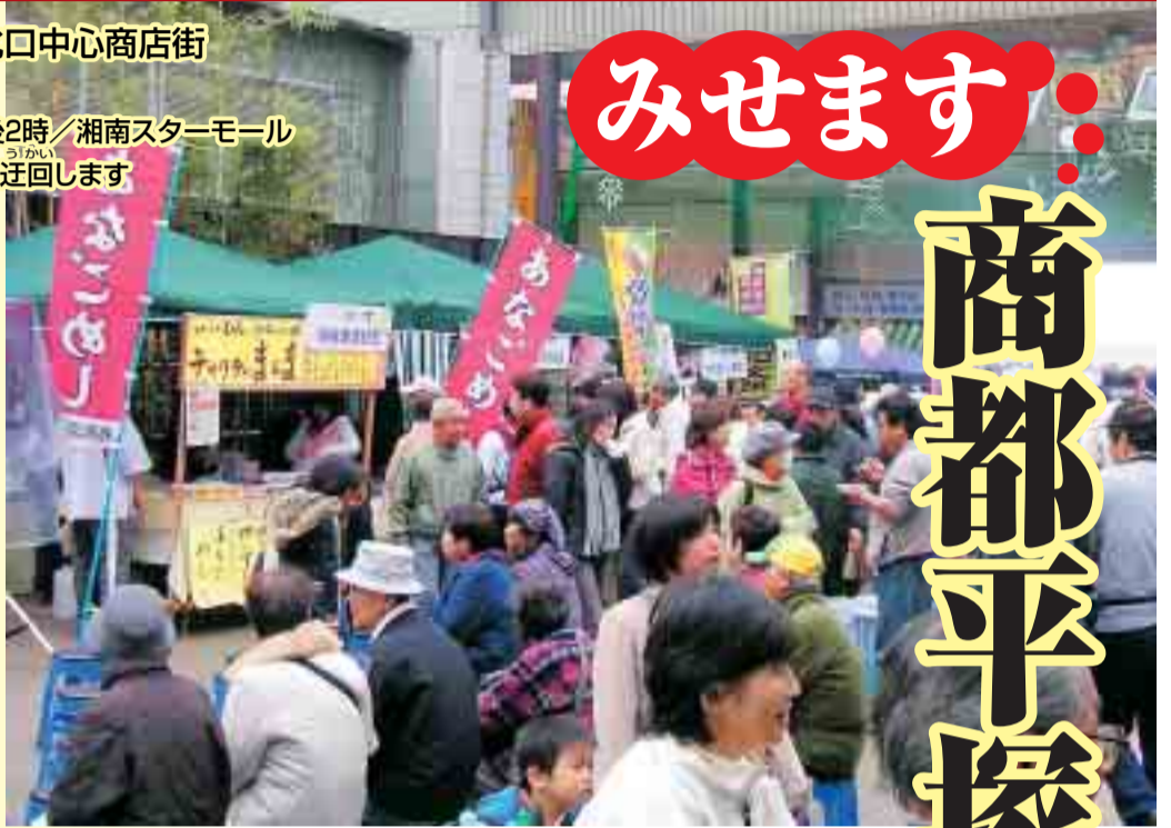
昨年の「平塚商業まつり」。紅谷町まちかど広場は大盛況でした

小田原や三浦半島から遠くは熱海まで。平塚はかつて商圏人口50万人を誇る一大商業都市でした。往時を支えた商人の心意気は今も受け継がれ、各商店はよりよい商品やサービスを提供するため、日々努力を続けています。11月10日(土)・11日(日)、市内で営業する多くの商店が中心商店街に出店し、自慢の逸品やサービスを提供する「平塚商業まつり いのちもんひらつか魅つけ市」を開催します。活気あふれる会場にぜひ、お出かけください。