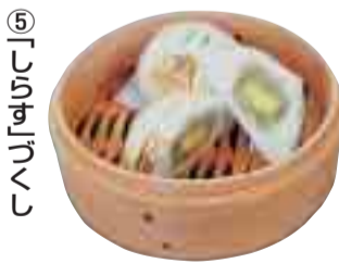
11月下旬までの期間限定販売で1個220円。製造は鳥仲商店(黒部丘2-3)

平塚産小麦粉「ニシノカオリ」をベースにした手打ちうどん教室を開催します。また、平塚市料理飲食業組合連合会がB級グルメとして考案した「湘南平塚めん」数種類の中から、「湘南平塚名物これがうまいめん」を投票により選んでもらいます。