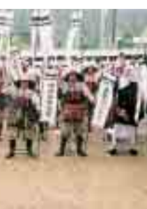
勇壮な武者振りをお見逃しなく

初代歌川広重・三代歌川豊国合作の浮世絵などを参考に平塚宿旅館の夕食膳を再現します。