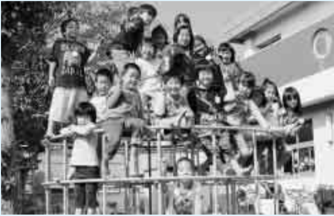
笑顔いっぱい、元気に遊ぶ保育園児たち

来年4月に市内の保育園へ入園を希望するお子さんの受け付けが始まります。※4月入園の受け付けはこの期間のみです