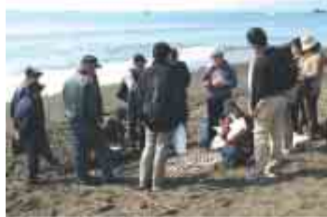
海辺の漂着物から自然を学ぶ「漂着物を拾う会」の活動

海岸を歩いて、きれいな貝殻を拾う遊びは、だれもが一度は体験したことがあるのではないのでしょうか。波に洗われて、元の形をとどめないほどに円くなったり貝がらや陶器、瓶のかけらは独特な風合いを持ち、小さな宝石のようでさえあります。 「ビーチコーミング」という浜辺での楽しみ方が、しばしばメディアで取り上げられます。一般には「浜辺で拾い物をする趣味」という意味で使われる言葉です。浜辺には、海からいろいろなものが流れ着きます。貝殻(ときには貝そのもの)、ヒトデ、海藻、カニ、魚といった海の生き物から、木の実、木片、草の根、ザリガニなどの陸の生きもの、ペットボトル、空き缶、たばこ