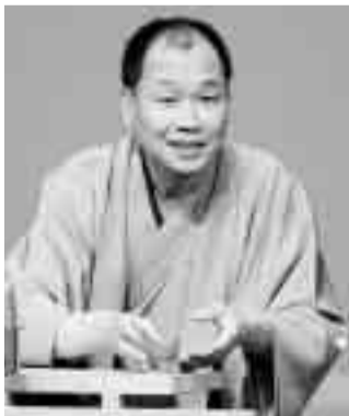
古典落語を通して、文楽や歌舞伎の男女観などをお話します