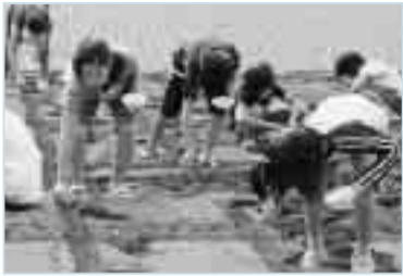
「元気に育ててほしいを込めて種まきをする豊田小学校の児童」