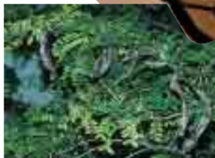
サイカチ 秋には長さ30cmにもなる豆果を実らせませす