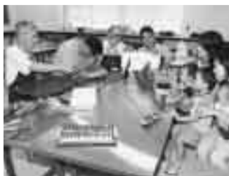
おもちゃの病院・ドクターくるりん

ご家庭に壊れてしまったおもちゃはありませんか。四ノ宮にあるリサイクルプラザでは、壊れたがん具を修理する「おもちゃの病院・ドクターくるりん」を開院しています。開院日は、毎月第3水曜日。子どもにとって宝物のおもちゃを通し、夢を育てるとともに、モノを大切に