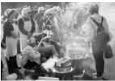
恒例の湘南炊き込みご飯大会

茶褐色の畑に種をまいた10月13日。参加した10人の子どもたちと一緒に、菜の花の楽しみ方に夢を膨らませました。「卒業式には菜の花で会場を飾りたい。菜種油で何の料理にチャレンジしようか?石けんは上手に作れるのか?」。いろいろな活用の仕方に、来春の開花が待ちきれない様子。「頑張って育てた菜の花がリサイクルされる仕組みを伝えていきたい」。この体験を通して「環境への思いやり」を子どもたちと学んでいきたいと話していました。