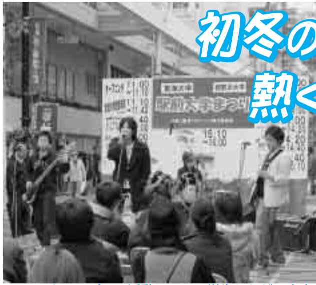
日ごろキャンパスで活動している学生たちが、商店街に飛び出します

駅北口中心商店街に飾り付けられるイルミネーションが、冬の街角を彩ります。期間中、「湘南ひらつかの文化や文芸の伝承」をテーマに、様々なイベントを開きます。