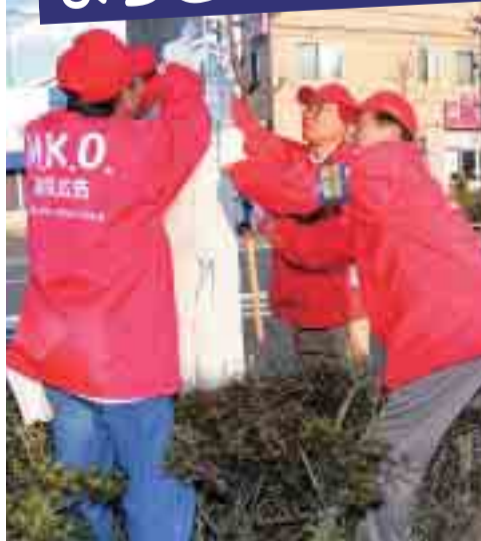
▲手作りの道具を使って電柱にはられた違反広告をはがすM.K.O.のメンバー