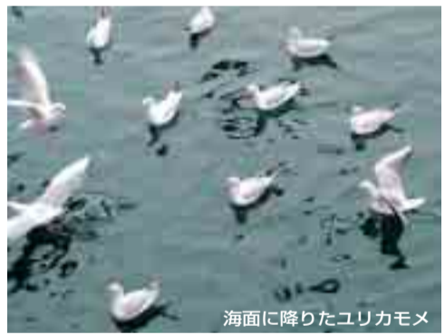
海面に降りたユリカモメ