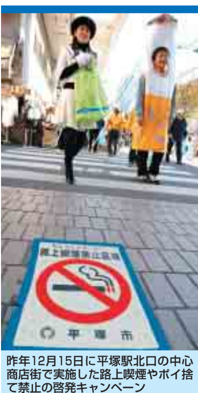
昨年12月15日に平塚駅北口の中心商店街で実施した路上喫煙やポイ捨て禁止の啓発キャンペーン

■変わりゆくまち・市民の意識 この条例で平塚駅北口の中心商店街を路上喫煙禁止区域に指定しました。そして多くの方が趣旨を理解して実行した結果、この区域内の路上でたばこを吸う人の数は大きく減りました(4面にエリアマップと統計データ)。 しかし、路上喫煙やごみのポイ捨てが完全になくなったわけではありません。まちを歩けば、まだ吸い殻やごみが目に付くところもあります。路上喫煙禁止 区域内を、くわえたばこで歩く人の姿も見かけます。その吸い殻は、多くの場合そのまま路上に捨てられ、確実にまちを汚しています。一部の人のわがままな行為が、わたしたちのまち平塚を汚しているのです。こんな身勝手は、決して許すことはできません。 一方、条例施行以前から数多く行われてきたまちの美化に取り組む市民活動は今、ますます盛んになっています。市民のみなさんによるこのような活動は、快適に暮らせるまちをつくるうえで、大きな支えになるものです。