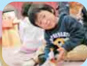
上手にできたでしょ