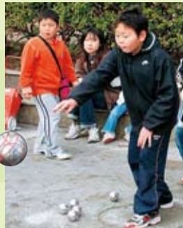
フランス生まれのペタンク競技