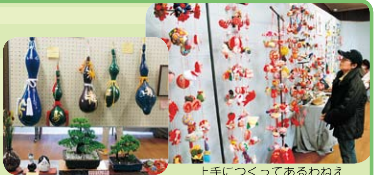
上手につくってあるわねえ