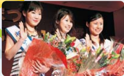
あなたも織り姫になりませんか