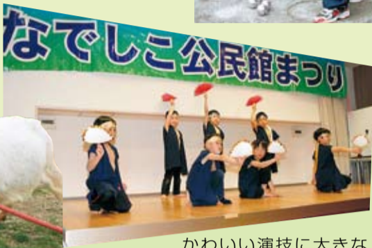
かわいい演技に大きな歓声が飛びました